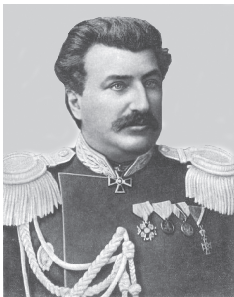
Николай Михайлович Пржевальски

Тот же, но позднее, нехитрый этот приём был проделан и с польским выпускником Сорбонны, журналистом и путешественником Антонием Оссендовским. Не