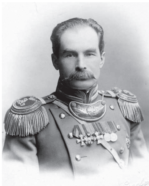
Пётр Кузьмич Козлов

Как бы то ни было, но факт бесспорный и единственный в своём роде: в его экспедициях всегда были железная дисциплина и порядок. За одиннадцать скитальческих лет Пржевальский не потерял