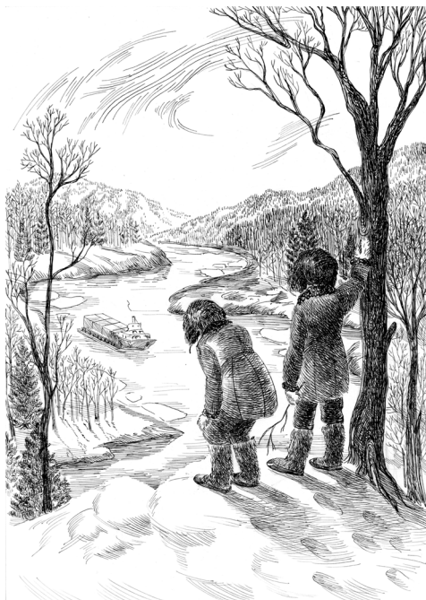
Рисунок В. Горьковой

Брат немногим далее чем я укатился от берега и упал. Неожиданно в этот момент лёд под ним треснул и провалился. Более чем по пояс оказавшись в воде, брат цеплялся руками за кромки льда, но