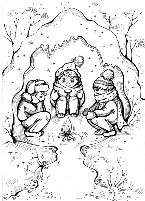
Рисунок Н. Ромашевой