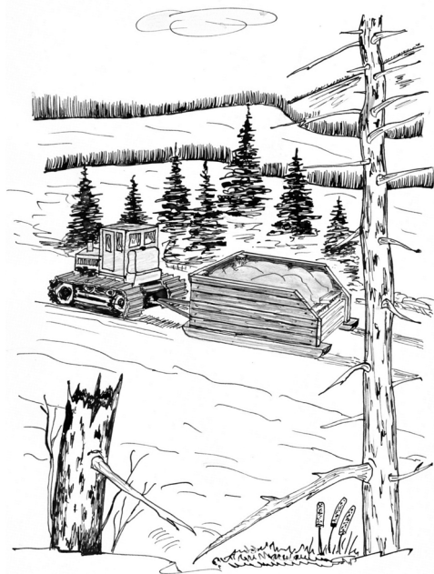
Рисунок А. Минченкова

В конце концов решение между ними было принято – переехать, не откладывая на следующий год, в эту же зиму на прииск Артёмовский. Предполагаю, причиной согласия матери на переезд в другой посёлок стало либо снижение работ на Светлом, либо ей было неудобно смотреть в глаза людям, что живёт с другим мужчиной. Сказалось, наверное, и проживание на Артёме далёких родственников, и её не пугал туда переезд. А, возможно, и всё вместе взятое.