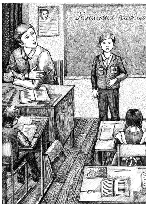
Рисунок Д. Даниловой

Света, достаточного для занятий письмом, явно не хватало, однако, как я сказал, мне хотелось быстрее выполнить