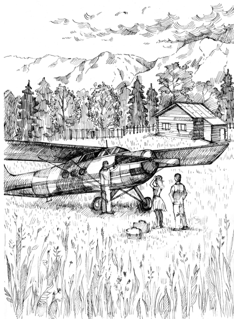
Рисунок Г. Кобелевой

Большинство мальчишек, услышав гул приближающегося самолёта или вертолёта, всегда устремлялись на аэродром поглазеть на летающую диковину, увидеть, кто прилетел, что привезли, как разбегается по земле, ревя мотором, и красиво взлетает крылатая машина. Я, как и многие мальчишки, в душе мечтал обязательно стать лётчиком, когда вырасту.