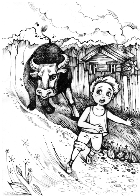
Рисунок Н. Ромашевой

ренном кино. Бык резко кинулся к нам. Спасаться от него бегством по улице было бессмысленно, он настиг бы нас сразу. Открыть калитку какой-нибудь ограды мы тоже не успели бы. Наше сознание одолевала одна только мысль: «Что делать?! Куда спрятаться?!».