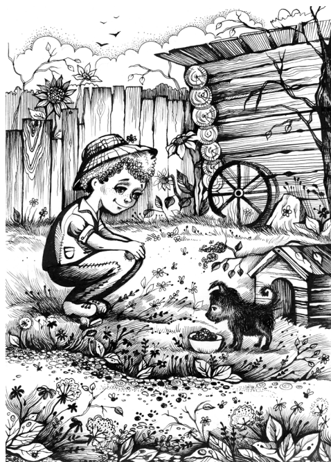
Рисунок Н. Ромашевой

Отец Букету соорудил собачью будку прямо под дровяным навесом. Щенок всегда был на улице, привязанный верёвкой к самодельному из старого ремня ошейнику. Когда я или брат были дома, мы отпускали его бегать в ограде. Если шёл дождь, он прятался в своём убежище. В свободное от школы время я иногда выходил из дома и с интересом гля-